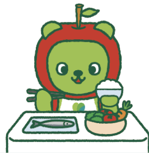
長野県PRキャラクター「アルクマ」 ©長野県アルクマ

ライフスタイルを変えなくても自分の食事を記録するだけで 健康意識が変わり、カラダも変わっていきます！